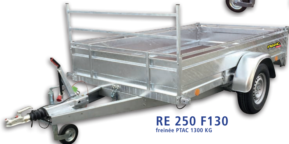
RE 250 F130 freinée PTAC 1300 KG