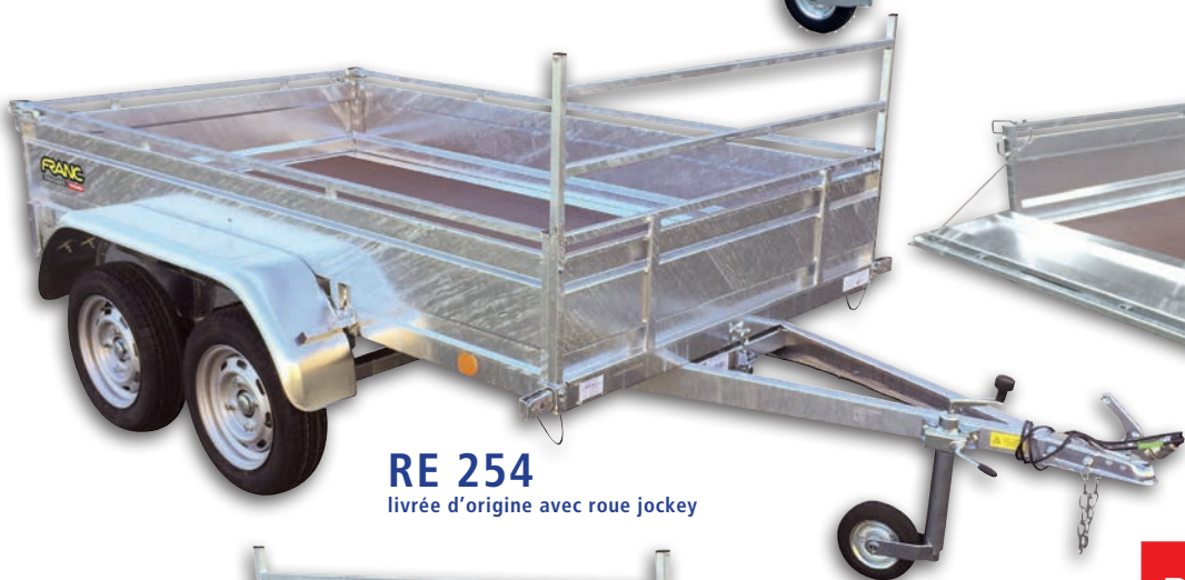
RE 254 livrée d'origine avec roue jockey

Pour toutes remorques fabriquées depuis le 29/01/2012, la remise du COC* est obligatoire par le distributeur. *Certificate Of Conformity