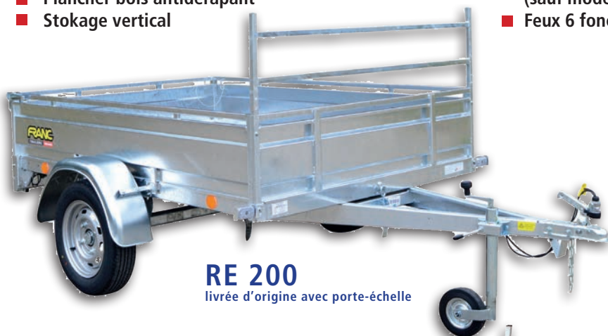
RE 200 livrée d'origine avec porte-échelle

Pour toutes remorques fabriquées depuis le 29/01/2012, la remise du COC* est obligatoire par le distributeur. *Certificate Of Conformity