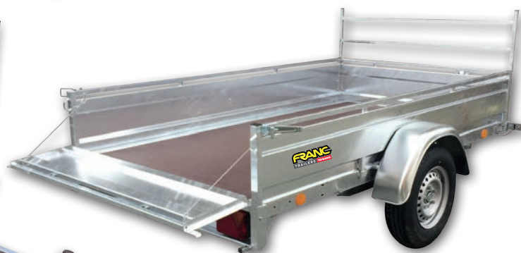
RE 250 livrée d'origine avec porte-échelle